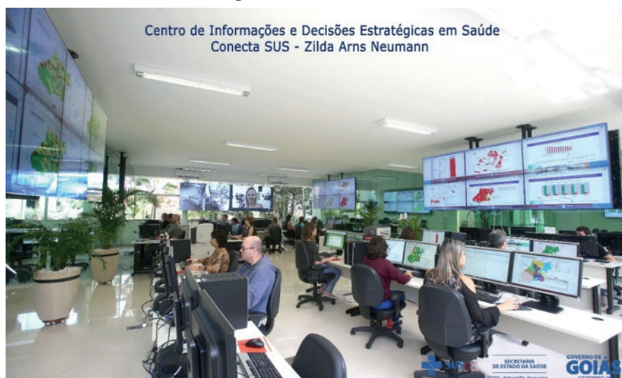
Figura 1. Conecta SUS