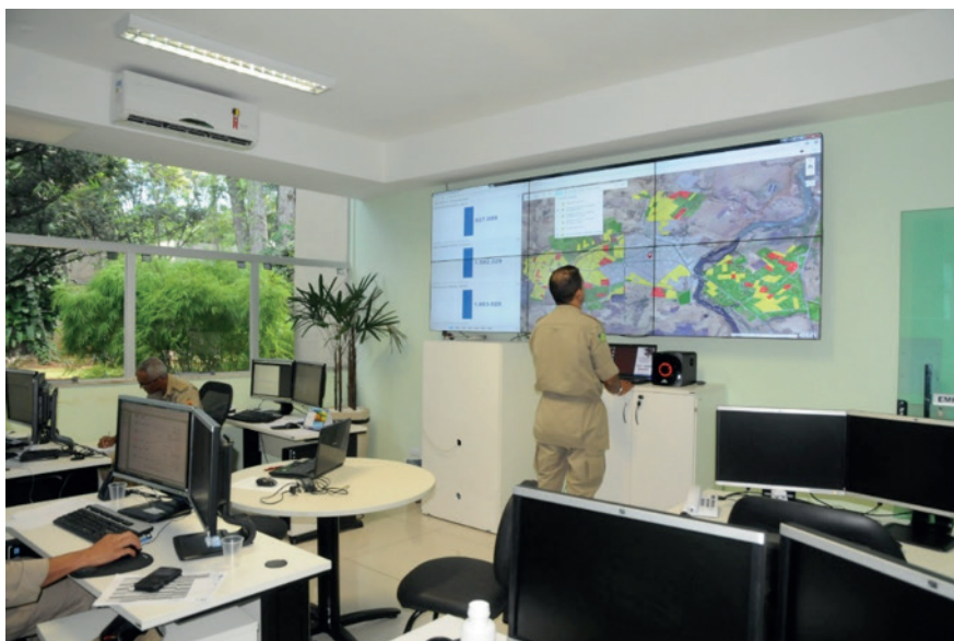
Figura 2. Painel de controle do SIMAZ no Conecta SUS