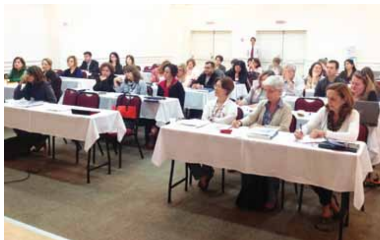
Aproximadamente 60 pessoas participaram do II Seminário: Modelo de Cuidado das Condições Crônicas na APS

unidades os espaços saúde com a finalidade de trabalhar a promoção da saúde e a prevenção. Porém, no encontro dos grupos (de hipertensos, diabéticos, tabagistas), o trabalho era baseado em entrega de medicamentos, aferição de pressão e palestras que, mesmo com empenho das equipes, não eram atrativas para os usuários.”