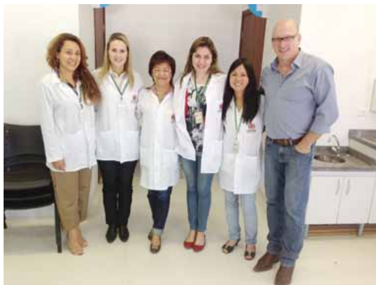
Equipe da Unidade de Saúde Alvorada e o coordenador da Atenção Básica da SMS de Curitiba

A terceira fase é a construção de uma segunda geração de oficinas de planificação com foco no modelo de atenção às crônicas.