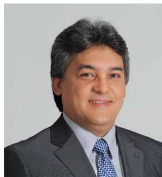
Ophir Cavalcante, presidente nacional da OAB

Para o presidente nacional da OAB, Ophir Cavalcante, o movimento é importante na medida em que insere um tema à margem da agenda nacional no centro das discussões. “Precisamos, porém, do engajamento efetivo da sociedade civil organizada, por intermédio de suas entidades representativas. No âmbito da Ordem dos Advogados, levamos esse as-