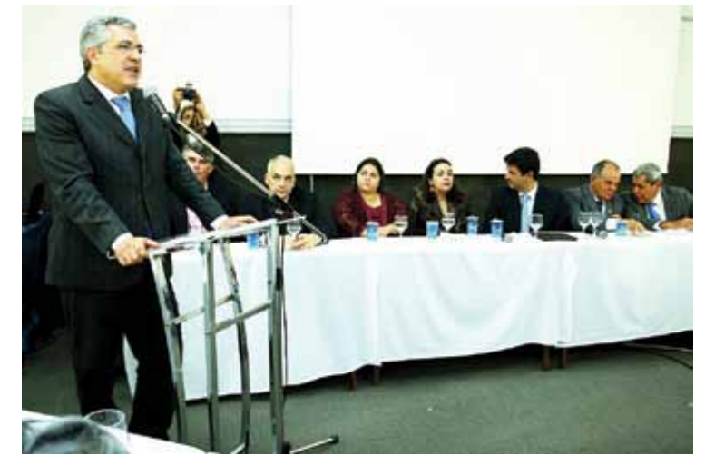
Ministro da Saúde, Alexandre Padilha, durante a assinatura do Coap em Mato Grosso do Sul

O Contrato Organizativo da Ação Pública da Saúde definirá as responsabilidades individuais e solidárias dos Entes Federativos em relação às ações e aos serviços de saúde, os indicadores e as metas de saúde, que devem ser estabelecidos visando à humanização