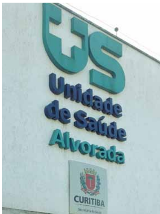
A Unidade de Saúde Alvorada foi escolhida para a implementação do projeto piloto do modelo de atenção às condições crônicas,

A partir da escolha da Unidade de Saúde Alvorada para a implementação do projeto-piloto do modelo de atenção às condições crônicas, as novas metodologias e maneiras de agir foram colocadas em prática. A classificação de risco foi considerada um fator positivo para o novo modelo adotado pela equipe.