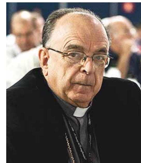
Dom Raimundo Damasceno, presidente da CNBB

Desde o seu lançamento, o CONASS tem incentivado, em suas Assembleias, a promoção do Movimento em todos os estados da Federação. O primeiro a mobilizar-se em favor da iniciativa foi o estado de Pernambuco que, no