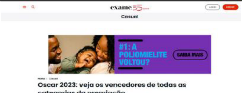
Portal - Exame

Além disso, foi desenvolvida uma extensa campanha de publicidade digital; com foco em redes sociais da META (Facebook e Instagram), Google, sites/portais (como UOL, Globo, Exame, Folha e Valor Econômico) e mídia externa digital, como telas em terminais de ônibus e de metrô.