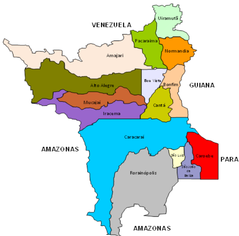
DISTRIBUIÇÃO DA POPULAÇÃO (Projeção IBGE 2016)