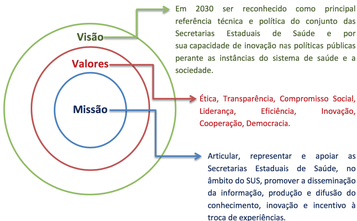
Figura 1 - Missão, Valores e Visão do Conass.